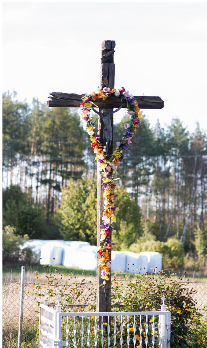
Fot. 33. Blachowo, ul. Lipowa 1. Krzyż drewniany z XIX w. fundacji rodziny Lemańczyk