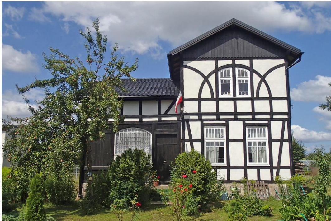
Fot. 18. Brusy, ul. Targowa 14. Dom Austenów z 1. poł. XX w.