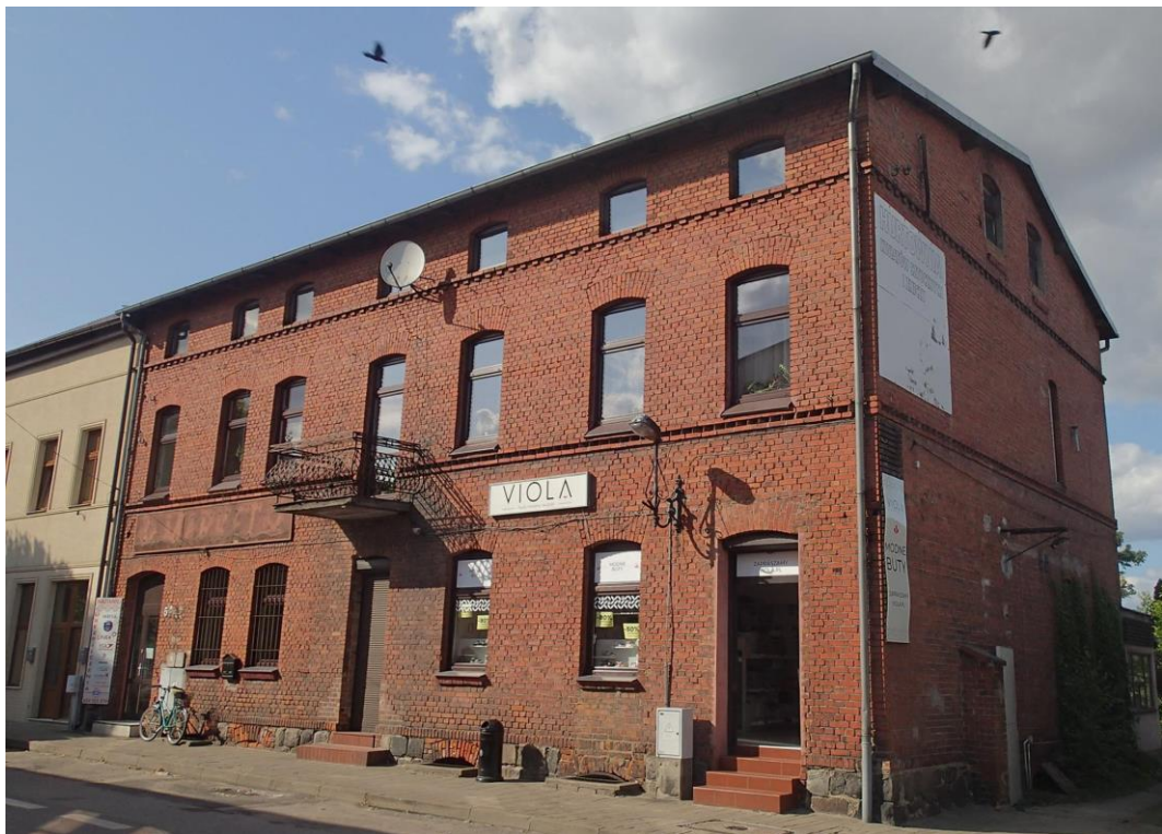
Fot. 20. Brusy, ul. Pocztowa 5. Budynek dawnej poczty z 1. poł. XX w.