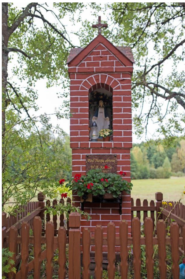
Fot. 32. Czyczkowy. Kapliczka NMP Niepokalanie Poczętej z 1948 r. fundacji rodziny Lewińskich