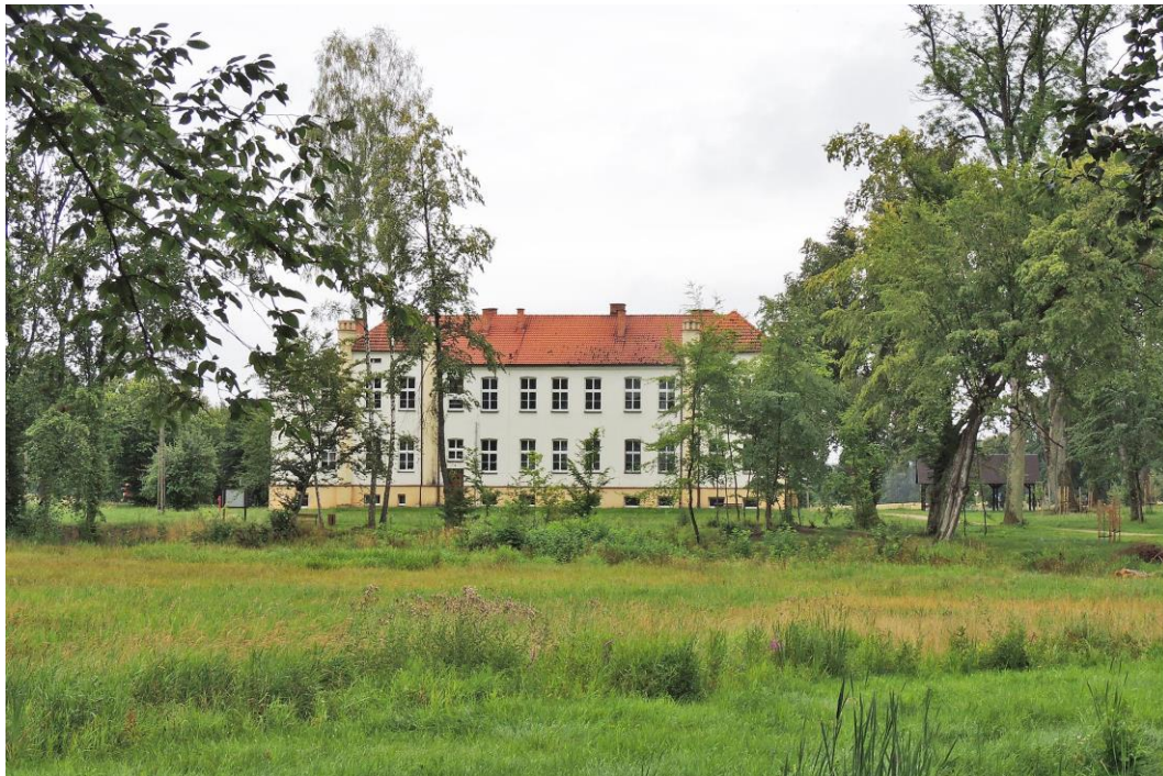
Fot. 9. Wielkie Chełmy 35. Pałac Sikorskich z 1. poł. XIX w.