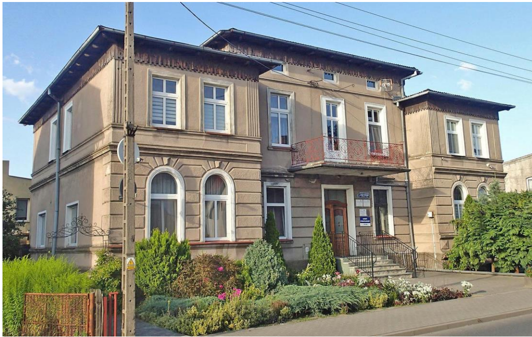
Fot. 17. Brusy, ul. Dworcowa 11-11A. Dawny dom Austenów z ok. 1900 r.