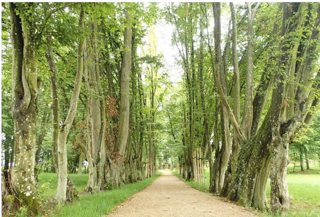
Fot. 10. Wielkie Chełmy 35. Aleja grabowa w parku przy pałacu Sikorskich z 2. poł. XVIII w.