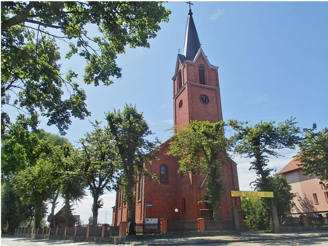
Fot. 5. Kosobudy, ul. Kościelna 1. Kościół p.w. Najświętszego Serca Pana Jezusa z ok. 1871 r.