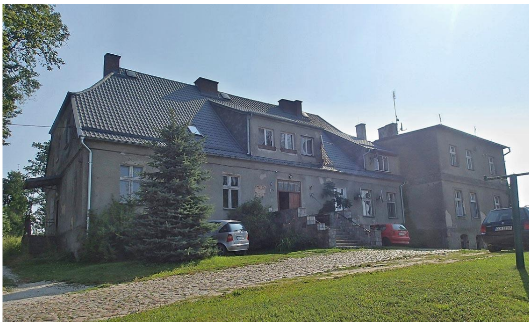
Fot. 12. Leśno, ul. Kaszubska 1-1A-1B. Dwór Sikorskich z 1. poł. XIX w.