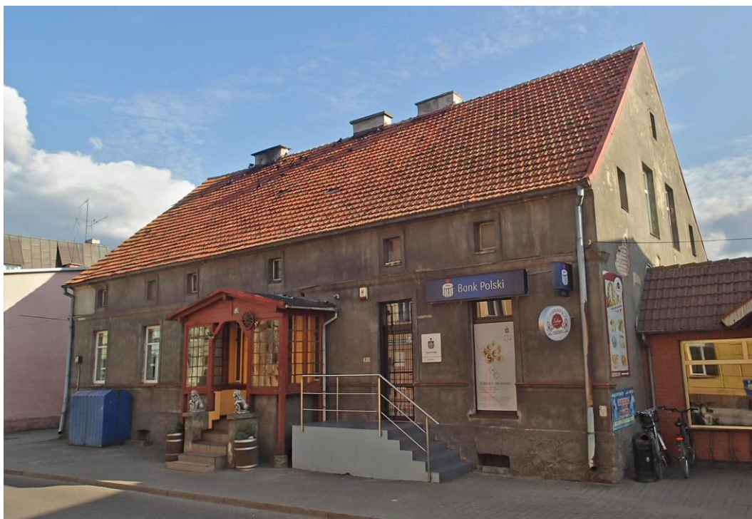
Fot. 15. Brusy, ul. 2. Lutego 10. Dom z ok. 1873 r.