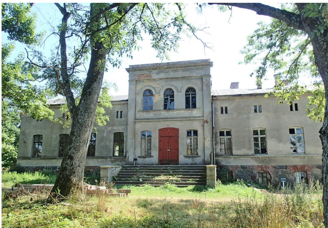
Fot. 14. Żabno 4. Dwór rodziny Raschke z ok. 1859 r.