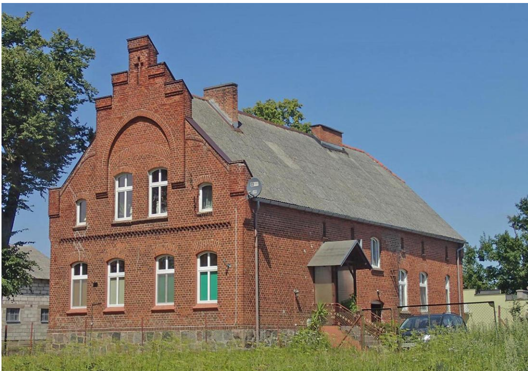
Fot. 6. Kosobudy, ul. Czerska 11. Budynek dawnej pastorówki z ok. 1900 r., obecnie przedszkole