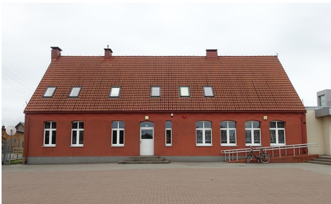
Fot. 30. Czyczkowy, ul. Główna 46. Budynek szkoły z początku XX w., zmodernizowany