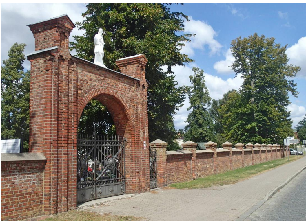
Fot. 4. Brusy, ul. Gdańska 3. Figura św. Jana Nepomucena na bramie i ogrodzenie cmentarza parafialnego, 1845 r.