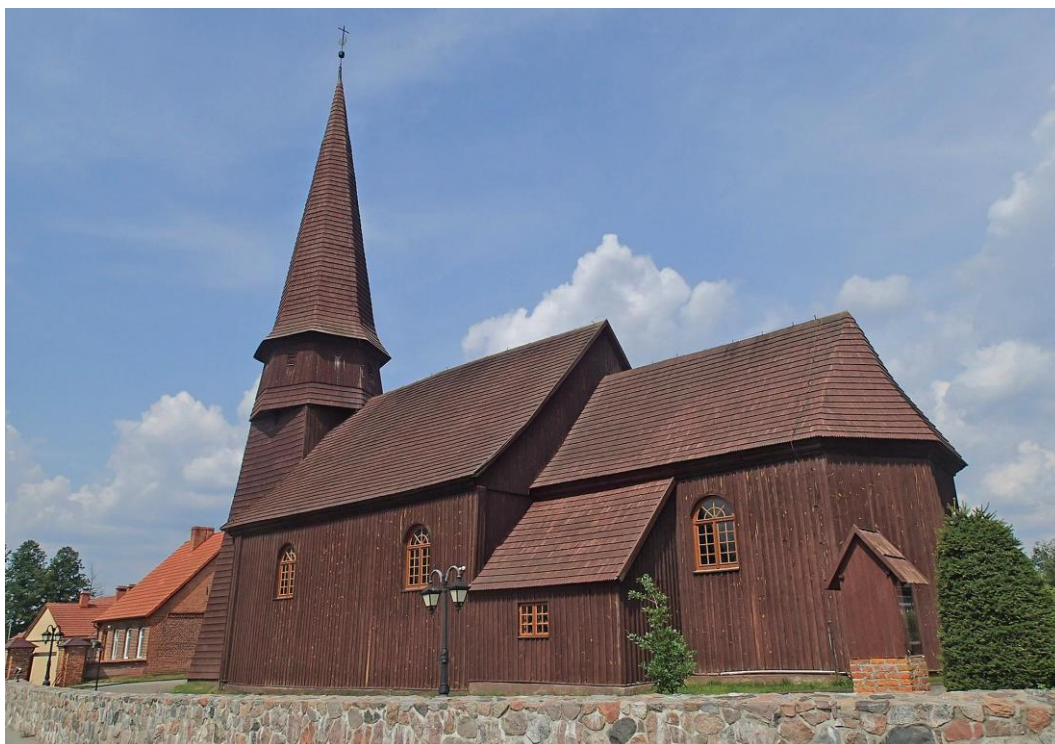
Fot. 7. Leśno, ul. Królowej Marii Ludwiki 1. Kościół p.w. Podwyższenia Krzyża Świętego z ok. 1650 r.