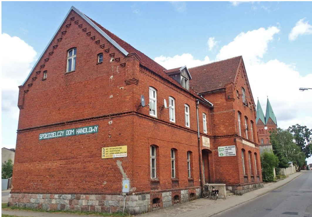
Fot. 19. Brusy, ul. Szkolna 1-1A. Spółdzielczy Dom Handlowy z ok. 1900 r.