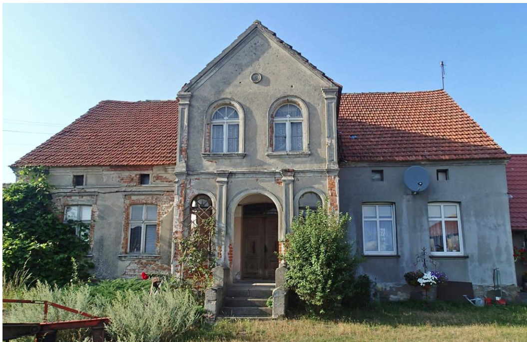
Fot. 13. Orlik 5a. Dwór Czarnowskich z ok. 1910 r.