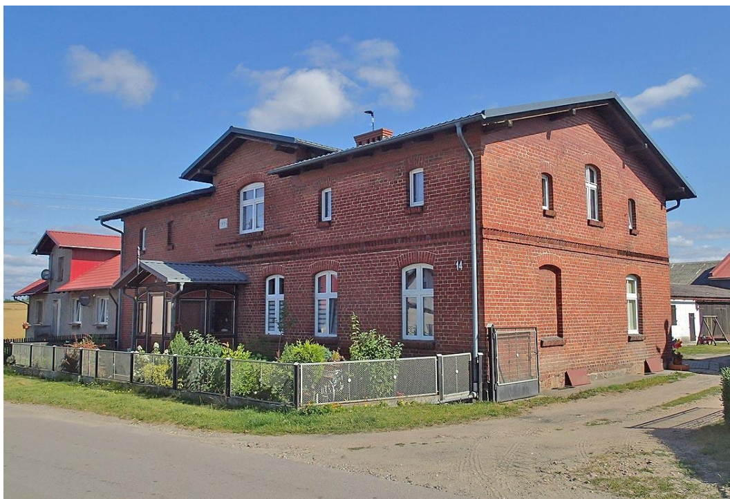
Fot. 23. Małe Gliśno 14. Dom z ok. 1914 r.