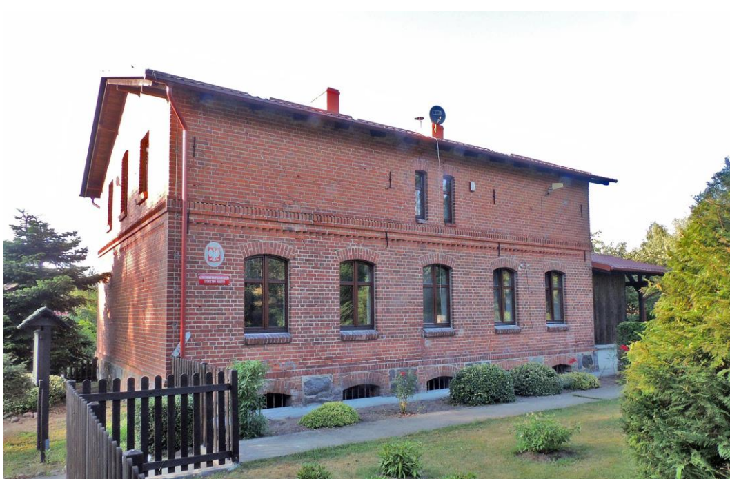
Fot. 26. Parzyn 1. Leśniczówka z 1. poł. XX w.