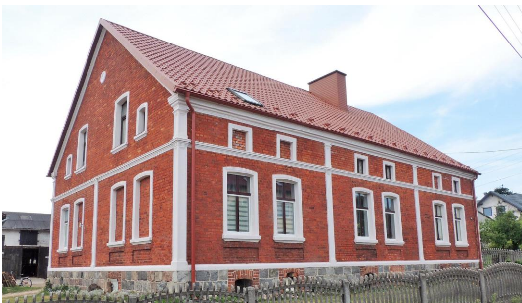
Fot. 24. Głowczewice 19. Dom z ok. 1900 r.