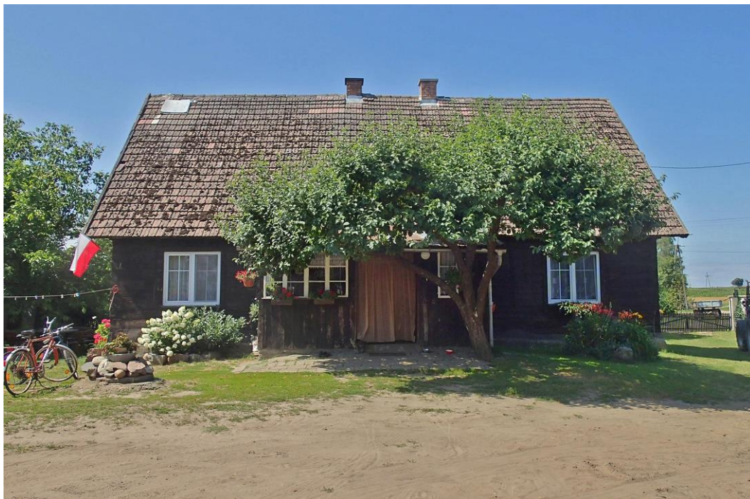
Fot. 21. Kinice, ul. Leśna 8. Drewniana chata z ok. 1880 r.