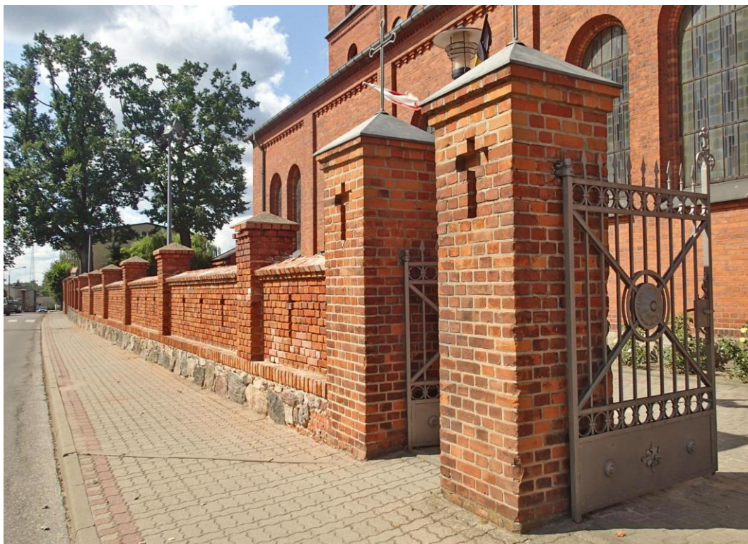
Fot. 2. Brusy, ul. Kościelna 2. Brama i ogrodzenie cmentarza przy Kościele p.w. Wszystkich Świętych, ok. 1830 r.