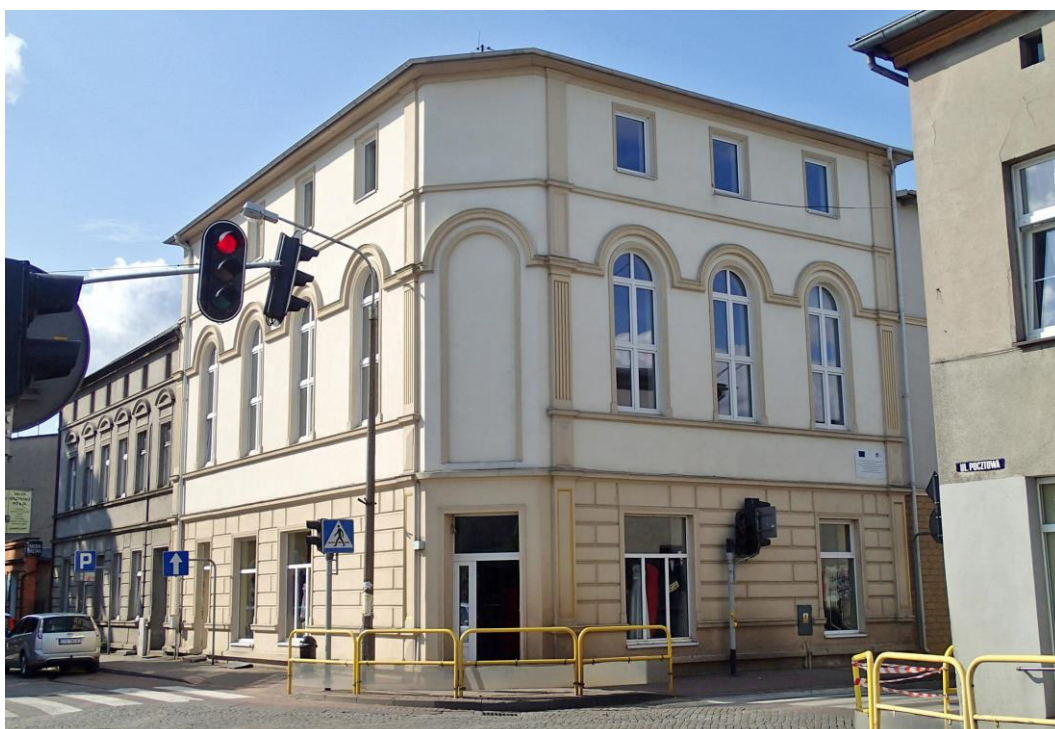
Fot. 16. Brusy, ul. Szkolna 2. Kamienica z ok. 1900 r.