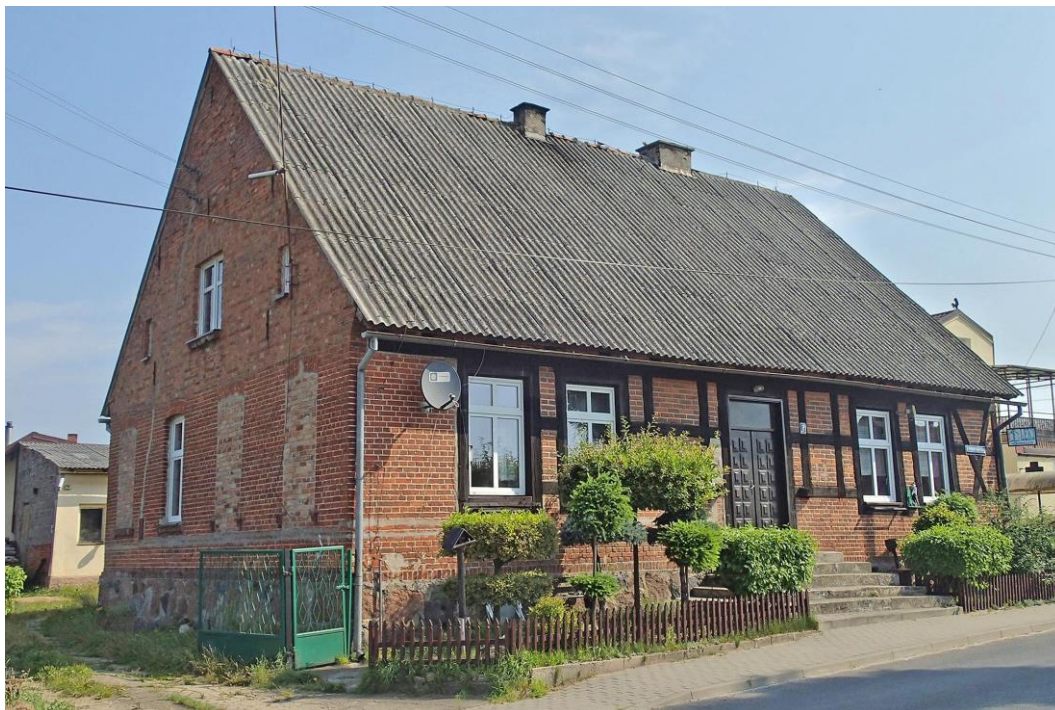
Fot. 29. Leśno, ul. Królowej Marii Ludwiki 2. Budynek dawnej szkoły z ok. 1850 r.