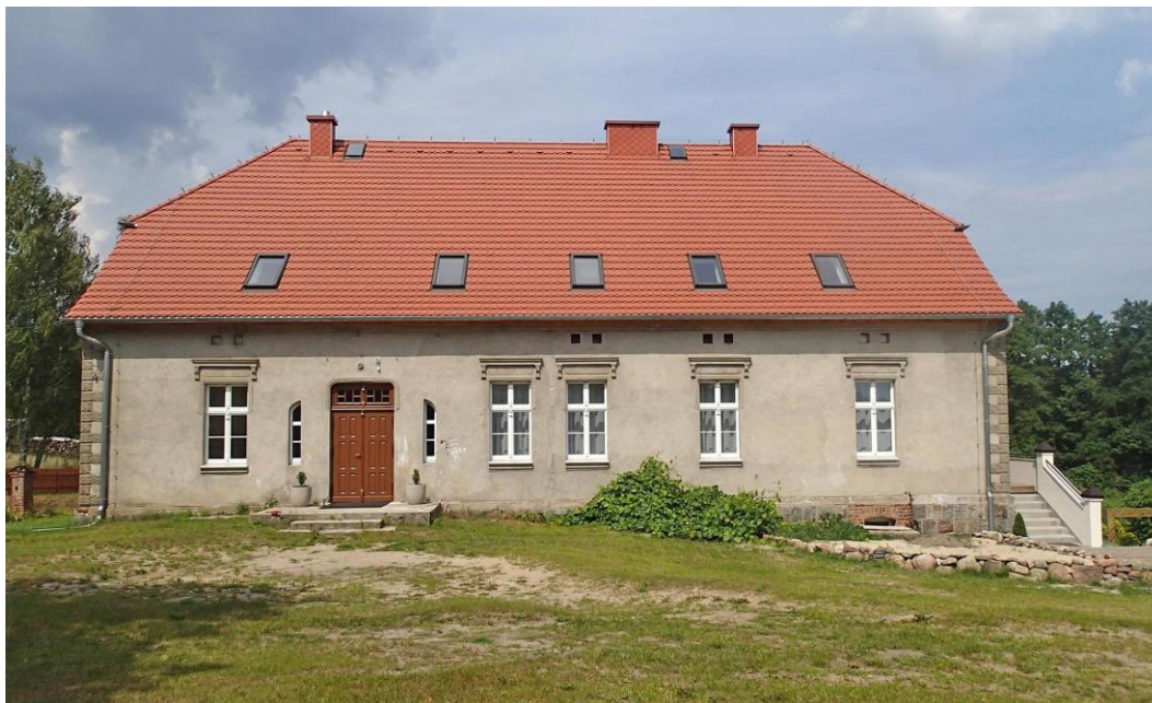
Fot. 11. Kaszuba 1. Dwór Kossak Główczewskich z ok. 1912 r.