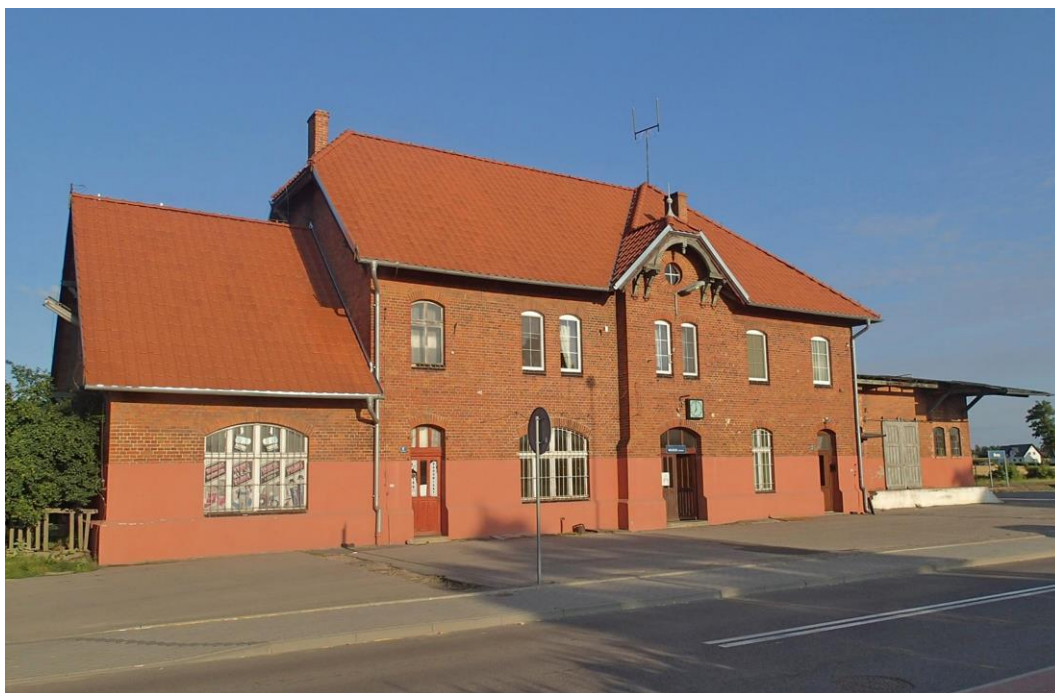
Fot. 27. Brusy, ul. Nad Dworcem 5-7. Budynek stacji kolejowej z ok. 1904 r.