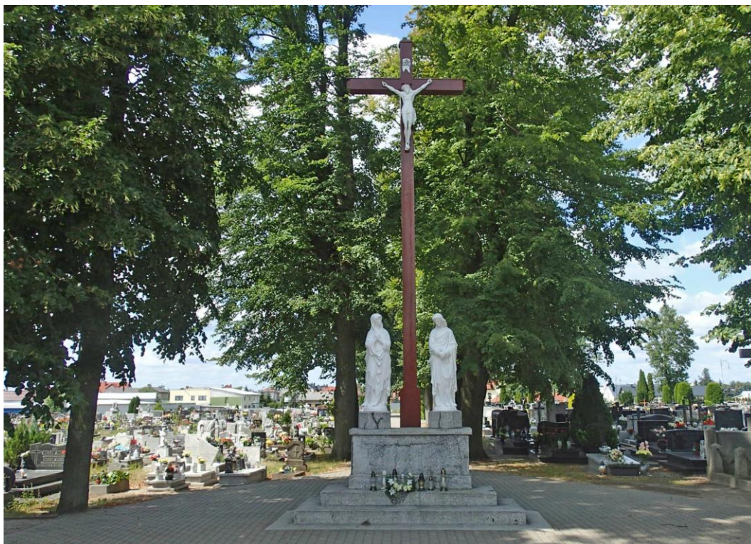
Fot. 3. Brusy, ul. Gdańska 3. Grupa ukrzyżowania na cmentarzu parafialnym, 1845 r.