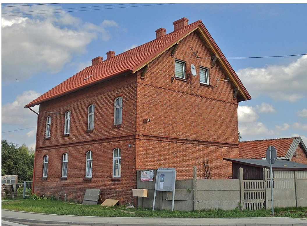
Fot. 28. Lubnia-Stacja, ul. Dworzec 6. Budynek mieszkalny przy stacji kolejowej z początku XX w.