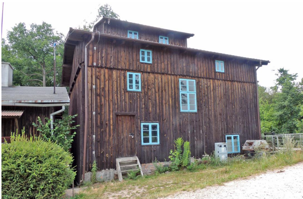
Fot. 25. Kaszuba. Młyn z ok. 1900 r.