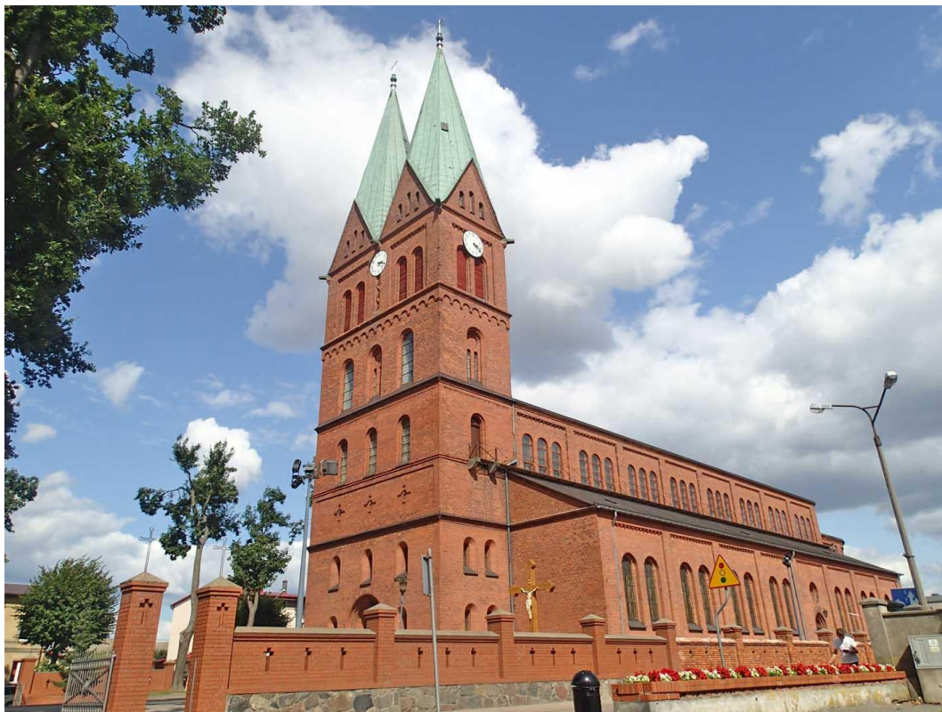
Fot. 1. Brusy, ul. Kościelna 2. Kościół p.w. Wszystkich Świętych, 1876-1879