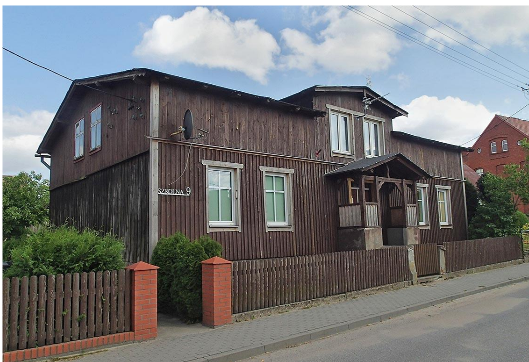
Fot. 22. Lubnia, ul. Szkolna 9. Drewniany dom z ok. 1900 r.