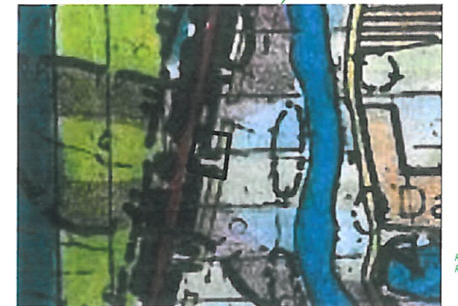
WYRYS ZE STUDYUM UWARUNKOWAŃ I KIERUNKÓW ZAGOSPODAROWANIA PRZESTRZENNEGO GMINY BRUSY

ORGAN SPORZĄDZAJĄCY PLAN: BURMISTRZ BRUSY